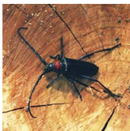
Aromia bungii (Asiatischer Moschusbockkäfer/AMB)