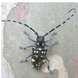
Anoplophora chinensis (Zitrusbockkäfer/CLB)