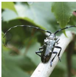
Anoplophora glabripennis (Asiatischer Laubholzbockkäfer/ALB)