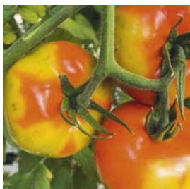
Tomato brown rugose fruit virus (ToBRFV/Jordan-Virus)